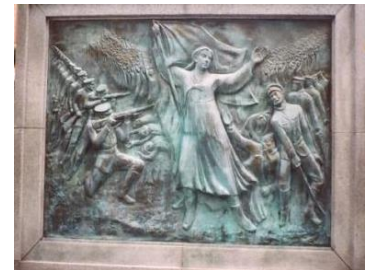
(パゴダ公園にある柳寛順のレリーフ)

三月一日、韓国ソウルで式典が行われ、文在寅大統領が演説し、各地で集会が開かれました。何の日だったのでしょう？ 百年前ソウル市中心にあるタブゴル公園で「独立宣言書」が読み上げられ、ソウルの街中が「独立万歳（トンニプマンセー）」の叫びで埋まった日です。