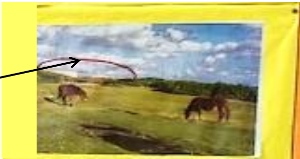
沖縄県与那国島。与那国馬が暮らす南牧場。この奥にミサイル拠点を狙われている。