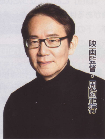
映画監督・周防正行