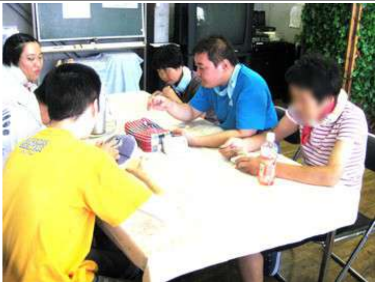
冷たくて、あまいバニラアイスさんに身体を冷やしてもらっています。