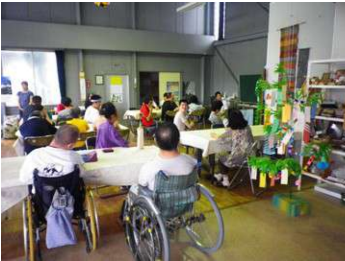
七夕の会。みんなの願いが通じますように。

七夕の日は、1年に1度だけ「おりひめ（織姫）」と「ひこぼし（牽牛）」が天の川の上でデートをする日といわれ、この日にちなんで、願い事を書いた短冊を笹の葉につるし、おりひめ星に技芸の上達を願うとされています。 わらしべの家でも、7月6日の午後から仲間の会主催で「七夕の会」が開かれました。 今年の七夕の会では、予定にはありませんでしたが、施設長が司会の人をサポートし、「たなばたさま」を大合唱。合唱団並みの迫力が、響き渡りました。 笹につるされた色とりどりの短冊には、「巨人が優勝してほしい」、「新しいアニメがテレビで、見たい」、「嵐に